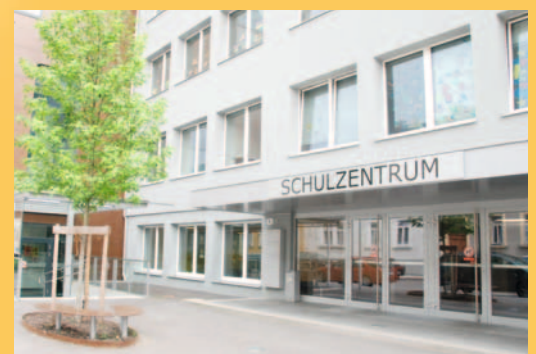
Eingang, Plenkerstraße 8a

Verband Niederösterreichischer Volkshochschulen